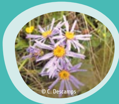
Aster Amelle Espèce protégée au niveau national