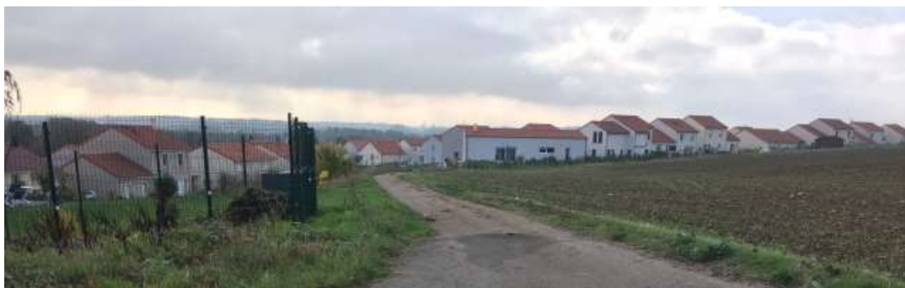
Lotissement du « Fercieux » et ouverture vers l'espace agricole

Le PLU calibre les besoins nécessaires pour les 15 années à venir, mais se place aussi comme une phase de réflexion sur l'avenir plus lointain de la commune. Ainsi, au-delà des zones ouvertes à l'urbanisation, des secteurs à préserver comme « réserve foncière » pourront être disposés aux abords du village. Dans ce sens, des accès seront maintenus à la fois pour une bonne desserte des espaces agricoles et pour des possibilités futures d'extensions urbaines. Dans les quartiers, les impasses introverties seront de même à éviter.