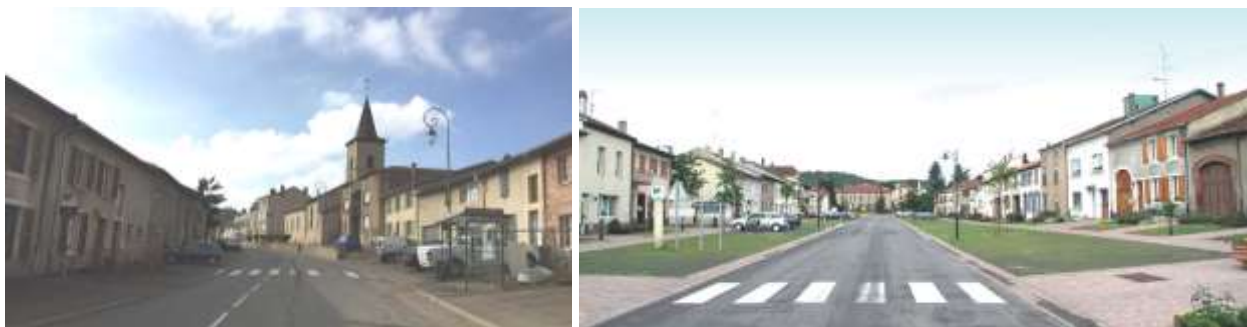
Rue de l'Isle Jourdain à Nouilly / Exemple de restructuration des anciens usoirs

Les anciens usoirs font partie des éléments de patrimoine, comme une prolongation, sur l'espace public, des pratiques agricoles aujourd'hui dépassées. Ces usoirs pourront être valorisés, tout en répondant aux besoins en stationnements , en particulier à l'intersection des rues de Servigny et de L'Isle Jourdain.