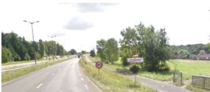
Carrefour de la RD 954 et RD954B desservant la future ZAC / exemple de bande piétonne le long d'une RD très circulée

Par ailleurs, les cheminements existants, traversant la campagne, pourront être valorisés en connexion avec les projets des communes voisines. (Comme ce fut le cas par exemple lors du balisage des balades Nature de Metz Métropole). L'ancienne voie ferrée pourra être le support d'un aménagement de la promenade existante, profitant de cette infrastructure aujourd'hui morcelée mais marquante dans le paysage.