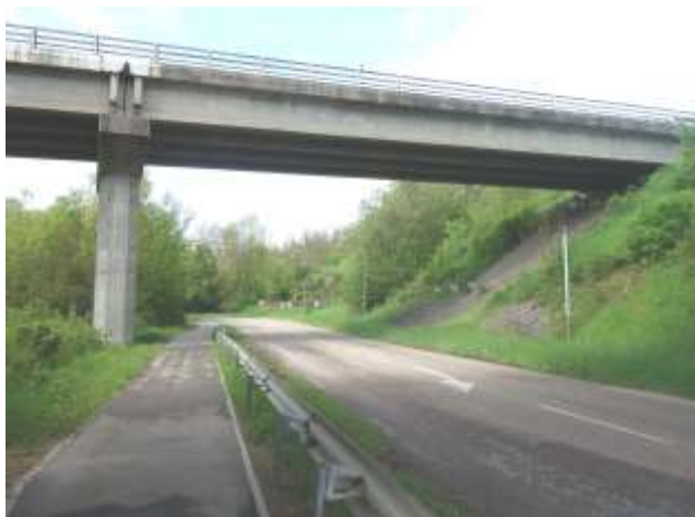
Passage sous l'autoroute, le long de la RD69

Cette liaison douce en bordure de RD pourrait éventuellement être une idée pour un aménagement de la RD 954, tout en restant prudent sur la faisabilité opérationnelle et considérant sa très forte circulation, la sécurisation obligatoire des piétons, les emprises foncières nécessaires, probablement en lien avec la commune de Montoy-Flanville, et jugeant les investissements financiers au regard de l'utilisation effective. Il s'agit d'une réelle opportunité à réinterroger lors des aménagements pour les accès à la ZAC de Lauvallières, en interaction avec les préconisations sécuritaires et techniques du département.