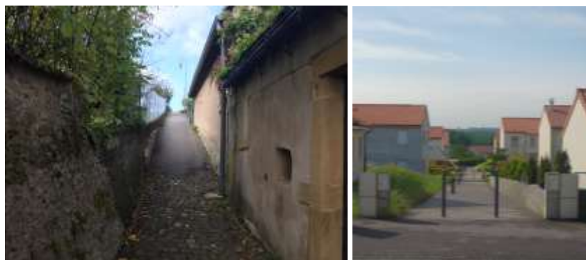
Chemin du Pressoir / liaison piétonne au sein du lotissement du Fercieux

De nombreux chemins, sentiers ou venelles dans le village, permettant de rejoindre les quartiers et les jardins ou vergers qui entourent les habitations. Cette structure participe au caractère pittoresque du village. Les dessertes depuis le cœur du village, vers les nouveaux quartiers offrent un bon maillage des espaces bâtis et devront être maintenus.