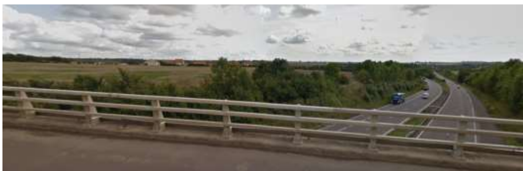
Vue depuis l'A315 sur le lotissement « Le Chêne ». L'A4 passe en dessous.

La commune est traversée par plusieurs canalisations de matières dangereuses. Leurs risques seront intégrés à la réflexion sur le développement de la commune, pour un bon compromis entre les bandes de danger et les potentiels des sites d'urbanisation.