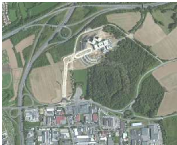
Situation de la ZAC de Lauvallières / Hôpital SCHUMAN récemment construit

La zone de développement économique occupée aujourd'hui par l'hôpital Robert SCHUMAN est attenante au secteur de l'Actipôle, de l'autre côté de la route départementale n°603 et s'implante « à cheval » sur les communes de Vantoux et Nouilly. Située en extension urbaine à proximité de grandes infrastructures de transport routier, comme l'A315, la RD603 ou la RD954, elle jouera un rôle majeur comme porte d'entrée de l'agglomération. Dans ce sens, ses aménagements devront trouver des solutions qualitatives pour répondre aux enjeux d'une valorisation des abords et de ses façades. Par ailleurs, le site comprend l'ancien fort de Lauvallières, qui pourra être reconsidéré pour profiter de ses potentiels naturels et patrimoniaux.