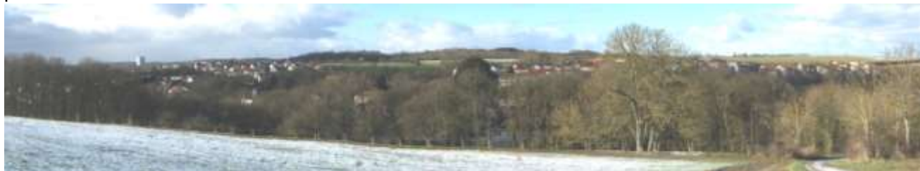
Vue depuis les hauteurs au sud du village. Les nouveaux lotissements se dégagent sur les coteaux nord.

La commune est aussi bien perceptible depuis les viaducs autoroutiers, mais ces points de vue ne peuvent être considérés comme des belvédères privilégiés. Notons qu'un projet de mur anti-bruit les masquerait probablement.