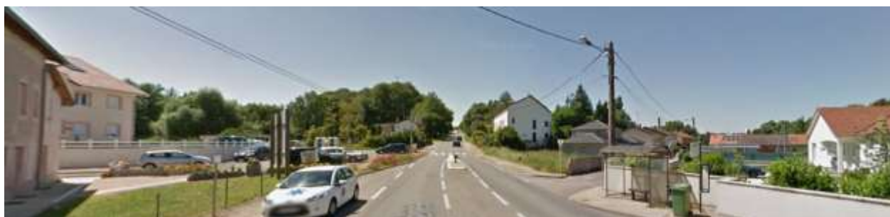
Hameau de Lauvallières, traversé par la route départementale n°954

En lien avec la problématique de la route départementale très circulée, il semble pertinent de limiter les nouvelles constructions au sein des hameaux, (Photo ci-contre) en particulier pour le groupe de bâtis de Lauvallières (à cheval sur les communes de Nouilly, Noisseville et Montoy-Flanville). La sécurité ne devra pas être aggravée. Les projets de renouvellement seront étudiés au regard des possibilités d'accès et de la gestion du trafic.