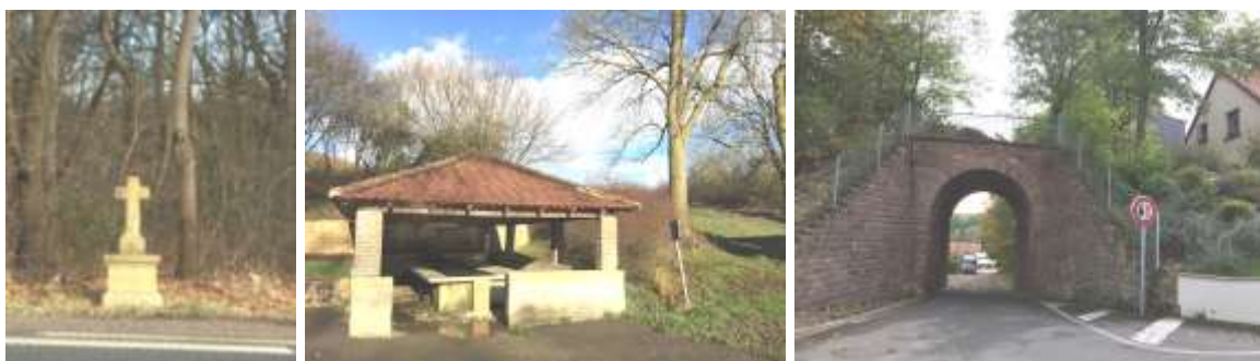
Calvaire le long de la RD69 / Lavoir du village / Tunnel sous l'ancienne voie ferrée, rue du Chenois

A ce patrimoine rural s'ajoute le patrimoine religieux avec l'église Sainte-Agnès, l'ancien pressoir ou le patrimoine militaire avec le fort de Lauvallières et les monuments dispersés dans la commune (quelques tombes militaires, calvaires, lavoir, ...). Les ouvrages d'art de l'ancienne voie ferrée peuvent aussi être considérés comme marquants à Nouilly, comme les étroits passages, tunnel sous la voie en grès rose. Le « petit » patrimoine tels que les murets de pierre, les chemins creux, venelles ou d'autres éléments anciens, devra faire l'objet d'une attention particulière, notamment dans les secteurs de développement futur du village.