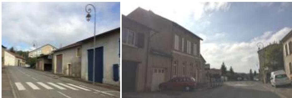
Anciennes granges au cœur du village / Bâtiment de l'école, potentiel de réhabilitation